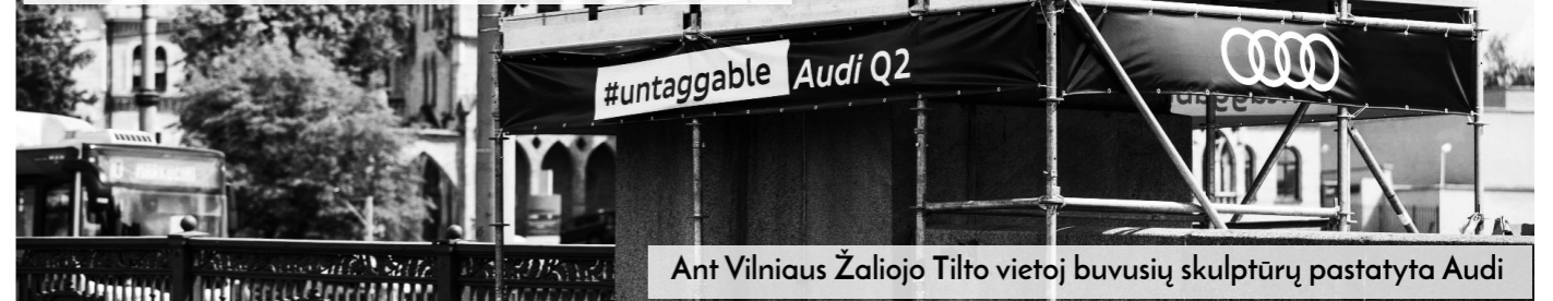
Ant Vilniaus Žaliojo Tiltų vietoj buvusių skulptūrų pastatyta Audi