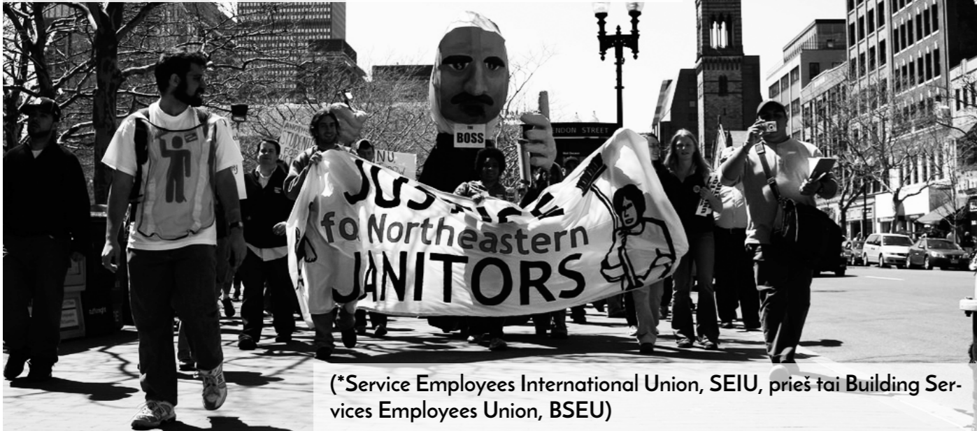
(*Service Employees International Union, SEIU, prieš tai Building Services Employees Union, BSEU)

Viena iš didžiausių šių dienų JAV profesinių sąjungų*, įsikūrusi 1921-aisiais metais, pradėjo nuo valytojų ir liftininkų darbo sąlygų gerinimo.